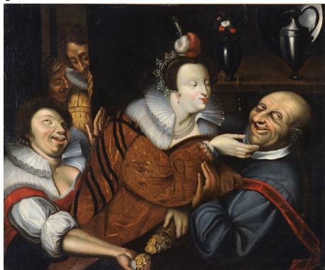
Quentin Metsys (cercle de)

Scène grivoise, 1er quart du 17e siècle Huile sur toile, 100x122 cm Musée des Beaux-Arts, Bordeaux