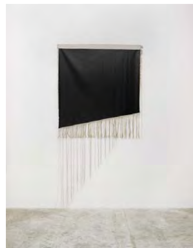
Luc Aubort, Franges 1.01 , 2011, acryl sur toile de lin brute, effilée, 250 x 500 cm. Courtoisie de l'artiste