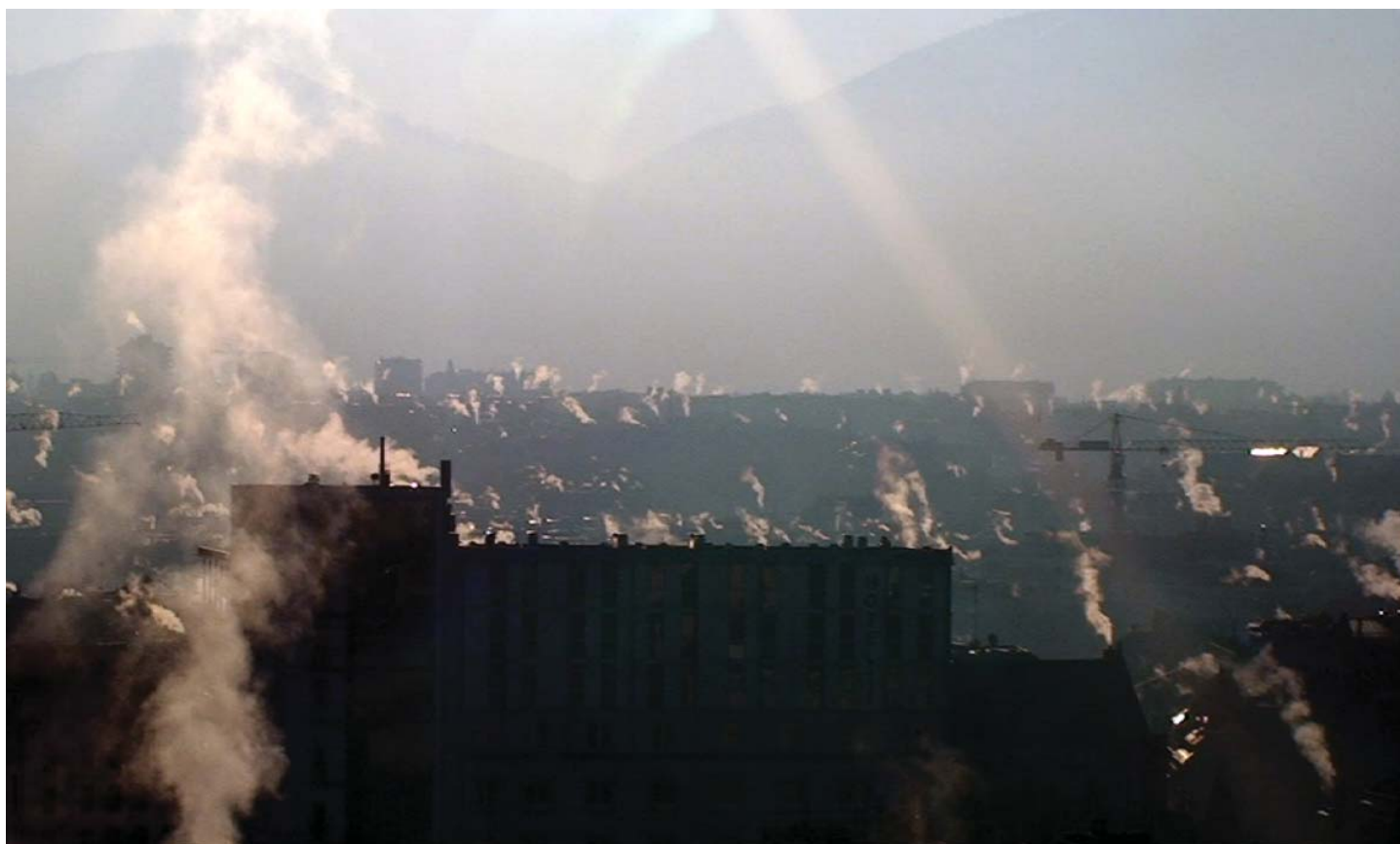
Anne-Julie Raccoursier, Chain Steam , 2011, vidéo, couleur, sans son.