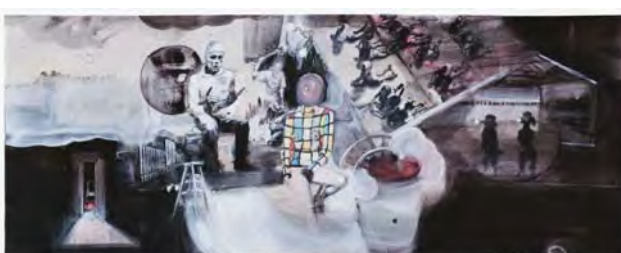
Elisabeth Llach, Vagues no 9 , 2011, acryl sur papier, 40 x 100 cm. Courtoisie de l'artiste