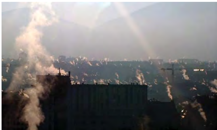
Anne-Julie Raccoursier, Chain Steam , 2011, vidéo, couleur, sans son. Courtoisie de l'artiste