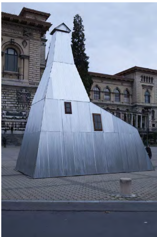
Yves Mettler, Reconstitution d'un puits de forage de pétrole (Arnex-sur-Orbe, 1929) . Festival Les Urbaines, Place de la Riponne, Lausanne, 2011.