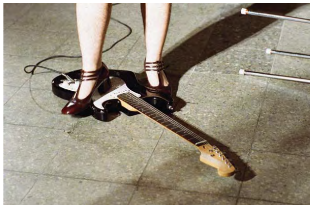
Pauline Boudry / Renate Lorenz, No Future / No Past , 2011, installation vidéo, couleur, avec son.