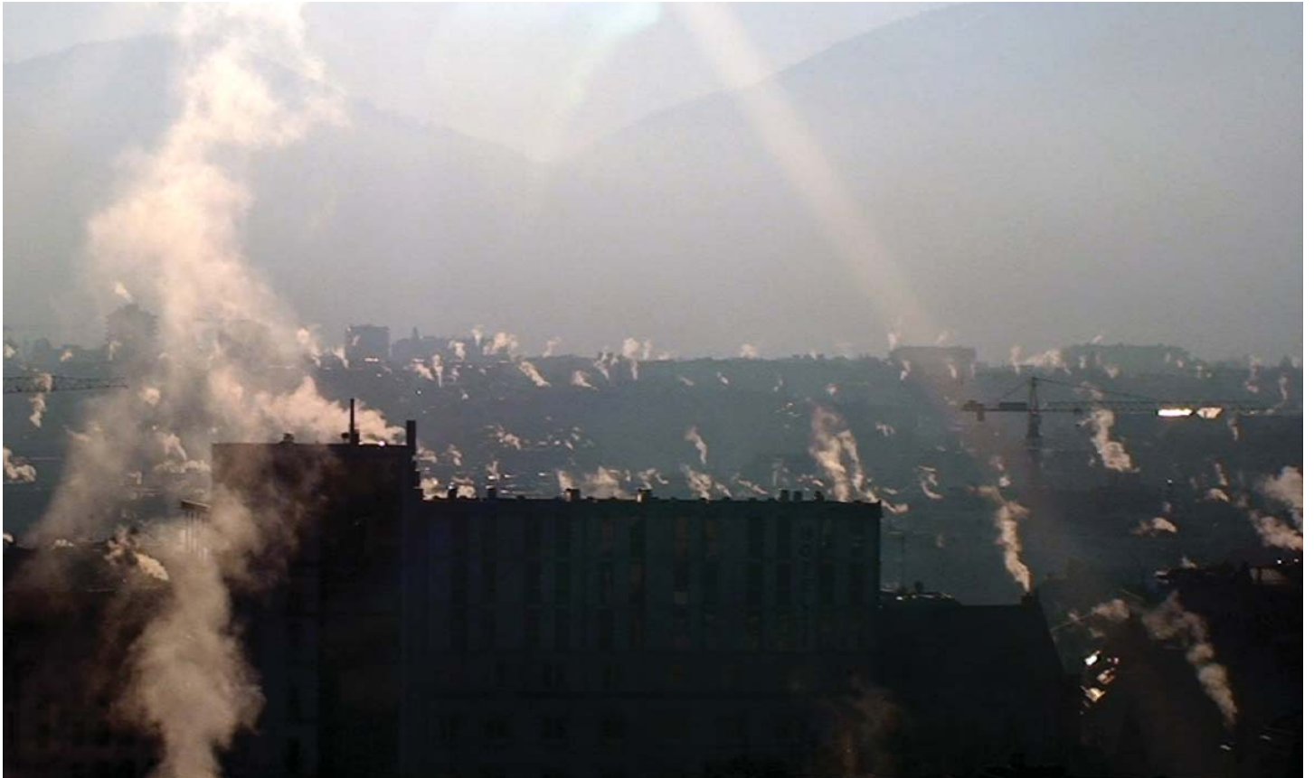
Anne-Julie Raccoursier, Chain Steam , 2011, vidéo, couleur, sans son.

Contact presse: Loïse Cuendet, loise.cuendet@vd.ch Tél. direct: +41 (0)21 316 34 48