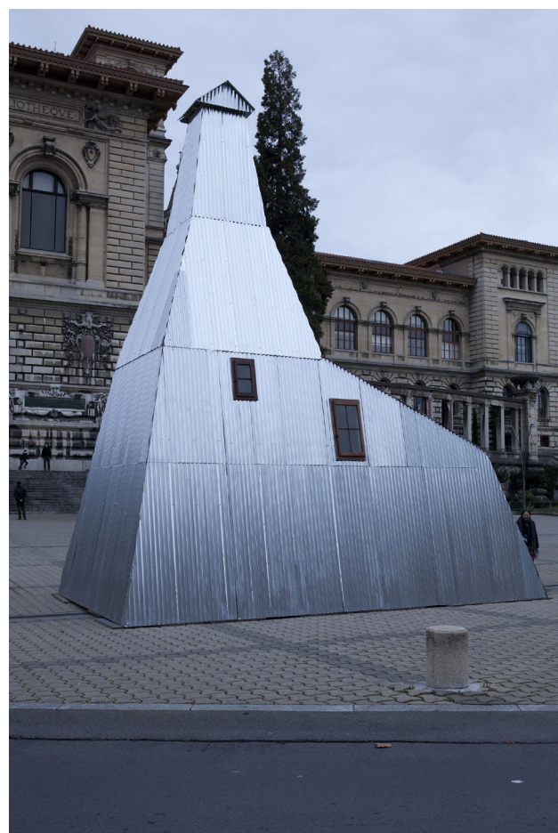
Yves Mettler, Reconstitution d'un puits de forage de pétrole (Arnex-sur-Orbe, 1929) . Festival Les Urbaines, Place de la Riponne, Lausanne, 2011.