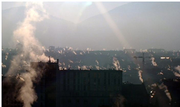
Anne-Julie Raccoursier, Chain Steam , 2011, vidéo, couleur, sans son. Courtoisie de l'artiste