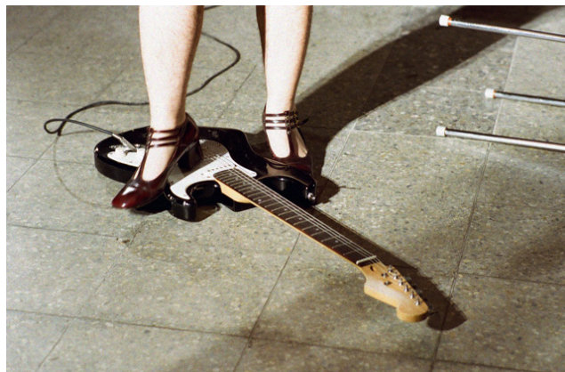
Pauline Boudry / Renate Lorenz, No Future / No Past , 2011, installation vidéo, couleur, avec son.