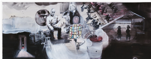
Elisabeth Llach, Vagues n° 9 , 2011, acryl sur papier, 40 x 100 cm. Courtoisie de l'artiste