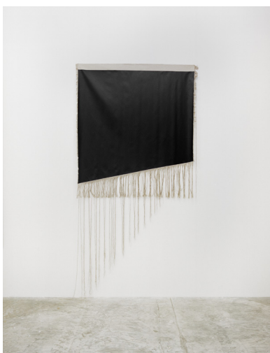
Luc Aubort, Franges 1.01 , 2011, acryl sur toile de lin brute, effilée, 250 x 500 cm.