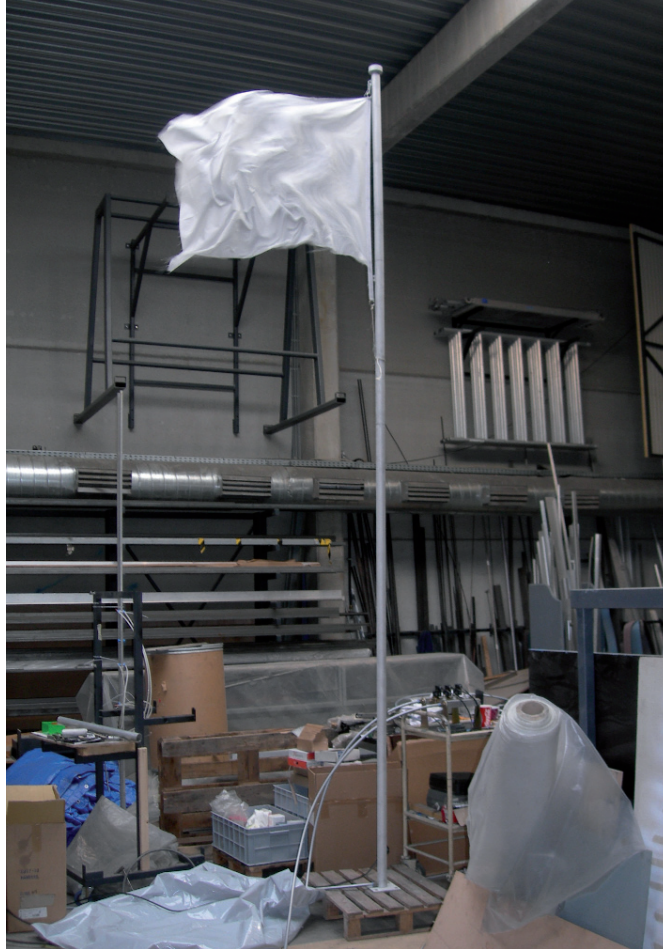
Michel François(*1956) Self-Floating Flag , 2007 Installation, drapeau et compresseur, Vue d'atelier