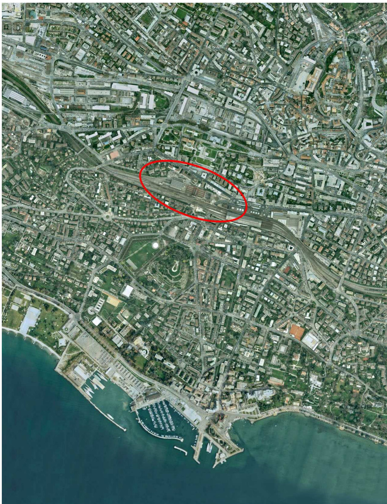
Localisation du site des halles CFF aux locomotives