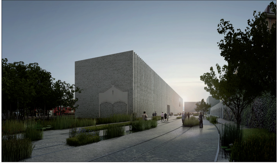
les auteurs décrivent un parc où la végétation s'inscrira entre les rails et où les platanes organiseront le lien entre la place du musée et celle de la gare.

La proposition cohérente et courageuse de ne conserver que des fragments des halles ne peut s'apprécier qu'en regard de la qualité de l'espace public proposé et de l'adéquation du volume simple et abstrait destiné au musée. Dans ce contexte, le projet