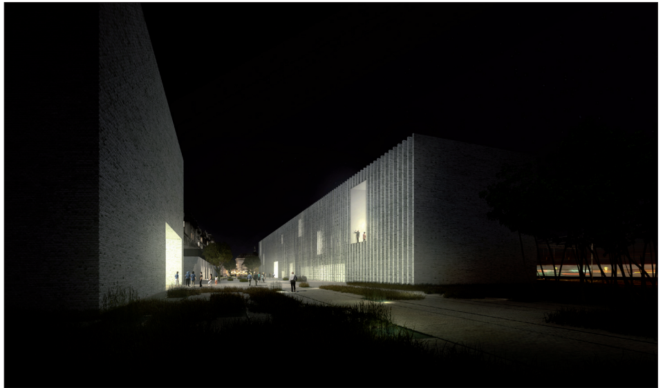
Les ouvertures au nord, disposées habilement, mettent le musée en relation avec la place, donc avec la ville.

Là où le pont roulant distribuait les locomotives, le fragment conservé de la nef centrale devient, comme une révérence, l'espace de l'accueil et de la distribution des visiteurs du musée.