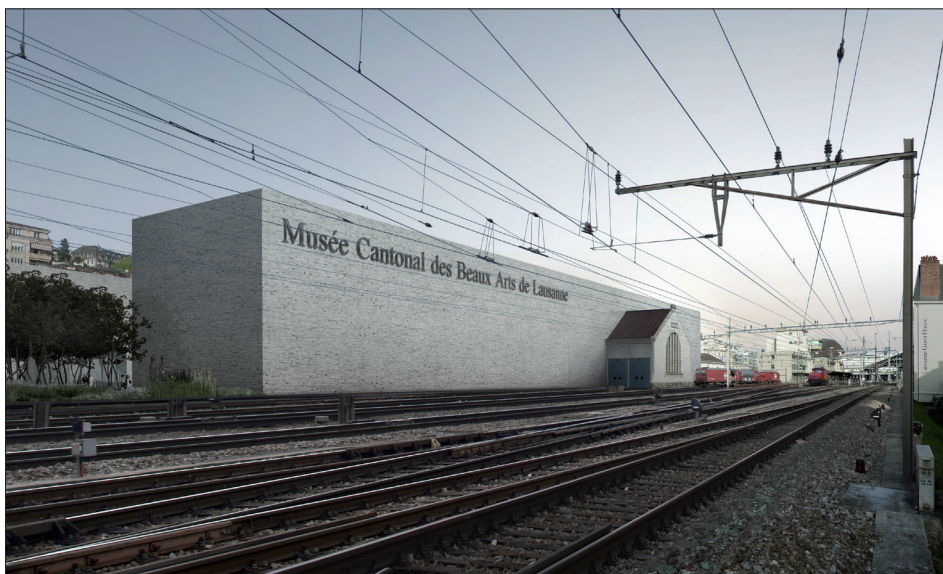
Le volume simple du MCBA définit d'un côté un prisme lisse en référence à la vitesse des trains, ponctué de la grande fenêtre conservée du pignon de la halle centrale.

Libéré de la géométrie des halles, le nouveau musée peut proposer des qualités tant fonctionnelles que spatiales, de distribution et de lumière sur les trois niveaux où se répartissent les différentes affectations. Mais ce projet « neuf » ne s'affranchit pas totalement des halles et de leur caractère dont il s'inspire pour provoquer les émotions recherchées. Là où le pont roulant distribuait les locomotives, le fragment conservé de la nef centrale devient, comme une révérence, l'espace de l'accueil et de la distribution des visiteurs du musée. Ici, la coupe est magnifiée à la dimension de l'institution, alors que tous les espaces d'ex-