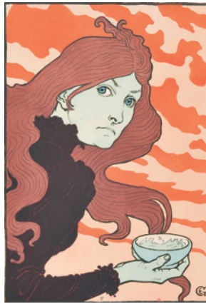
La Tasse de grès (La Vitrioleuse) , 1893 Chromolithographie, 39,5 x 27,5 cm Édité par L'Estampe originale © Paris, Institut national d'histoire de l'art Bibliothèque, collections Jacques Doucet