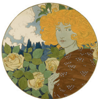
Jalousie (Dix Estampes décoratives, no 9) , 1897 Chromolithographie, 85,6 x 86,2 cm