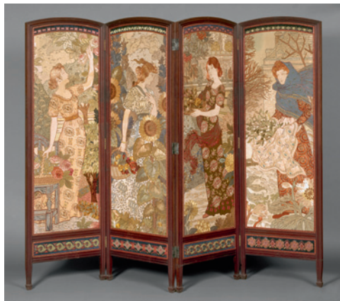
Paravent Les Quatre Saisons , s. d. Bois et broderies polychromes, 167 x 55 (x 4) cm