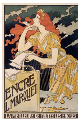
Encre L. Marquet – La meilleure de toutes les encres , 1892 Chromolithographie, 121 x 82 cm.