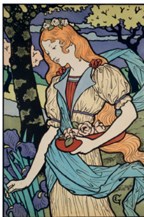
Exhibition of decorative artists in the Grafton Gallery London , 1893 Chromolithographie, 69 x 47 cm