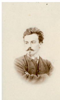
J. Tarin Eugène Grasset vers 1875 © Lausanne, musée de l'Élysée