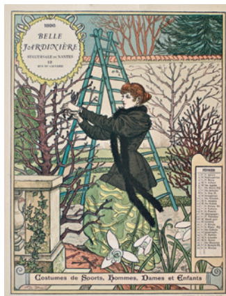
Février Page du Calendrier pour 1896 offert par La Belle Jardinière Chromotypographie, 23 x 18 cm.