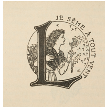
Semeuse (Je sème à tout vent) , vers 1890 Emblème des éditions Larousse © Lausanne, musée cantonal des Beaux-Arts Photo : Nora Rupp