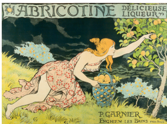
Abricotine. Délicieuse liqueur , vers 1900 Chromolithographie, 75 x 109,5 cm