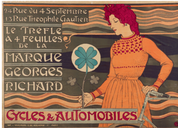
Le Trèfle à quatre feuilles de la marque Georges Richard. Cycles & Automobiles , 1897 Chromolithographie, 106 x 147 cm