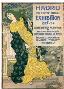
Madrid International Exhibition of 1893-94 Palacio de la Industria y de las Artes, 1893 Chromolithographie, 150 x 109 cm © Bruxelles, collection du musée d'Ixelles Photo : Mixed Media