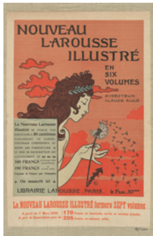
Nouveau Larousse illustré en six volumes , 1897 Chromotypographie, 57 x 38 cm