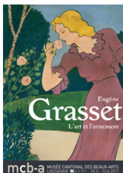
Affiche de l'exposition