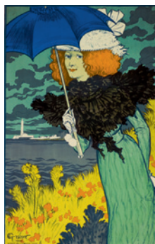
Le Parasol , 1900 Chromolithographie, 130,1 x 88,7 cm