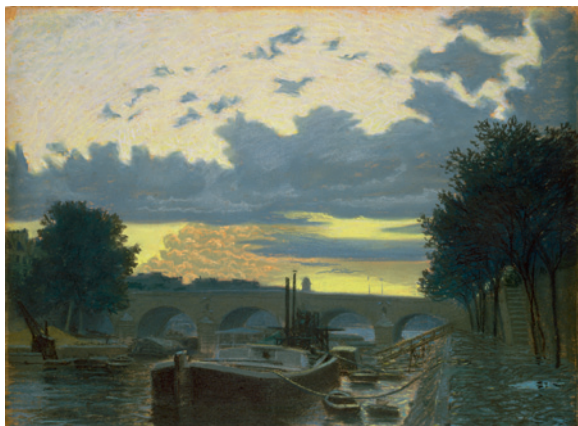
Après la pluie (Le Pont-Marie) , 1904 Pastel sur papier de couleur, 50 x 64,8 cm © Lausanne, musée cantonal des Beaux-Arts Photo : Nora Rupp