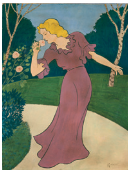
Femme à la rose , s. d. Plume et encre, aquarelle sur papier, 65 x 50 cm