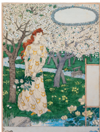
Avril Crayon et aquarelle sur papier vélin, 28 x 21 cm Projet pour le Calendrier pour 1896 offert par La Belle Jardinière