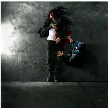
Annaïk Lou Pitteloud , Hover , 2007 Montage numérique. Impression lambda sur papier photo montée sous plexiglas (3/7), 180 x 180 cm