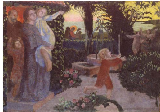
Maurice Denis, Septima hora , vers 1903 Huile sur toile, 63 x 90 cm