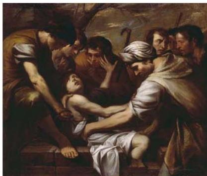
Andrea Vaccaro , Les fils de Jacob précipitant leur frère Joseph dans la citerne , vers 1640 Huile sur toile, 129,5 x 155,3 cm