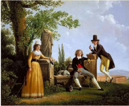
Jacques Sablet , Portrait de famille avec le Colisée , 1791 Huile sur toile, 60 x 72 cm