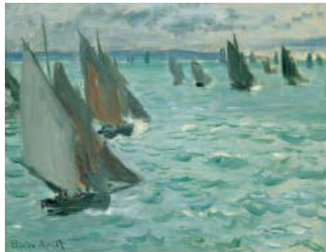
Claude Monet , Voiliers en mer , 1868 Huile sur toile, 50 x 61 cm © Lausanne, Musée cantonal des Beaux-Arts Legs de Mlle Edwige Guyot, 2006