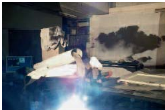
Alain Huck , Die, Die, Die (de la série Desdoneshadow ), 2009 Jet d'encre sur papier baryte monté sur aluminium (2/3), 74 x 111 cm