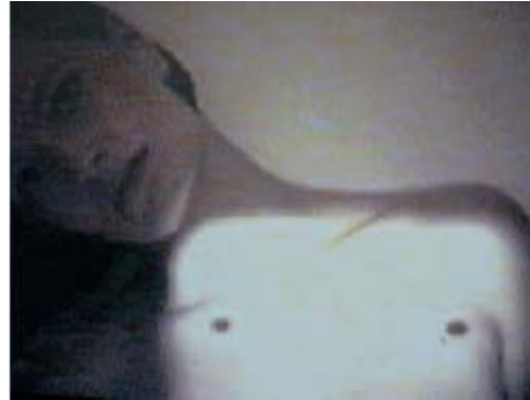
Jean Otth , Pudeur n° 104 , 1998 Monotype impression jet d'encre, 87 x 115 cm