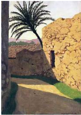
Félix Vallotton, Le palmier, Cagnes , 1920 Huile sur toile, 55 x 38 cm Dépôt à long terme de la Collection du Dr M. Bahro