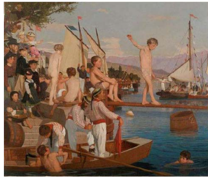
François Bocion, Jeux nautiques sur le lac Léman (La Fête de la Navigation) , 1870 Huile sur toile, 63,5 x 76 cm © Musée historique de Lausanne - Dépôt de la Société Vaudoise de Navigation