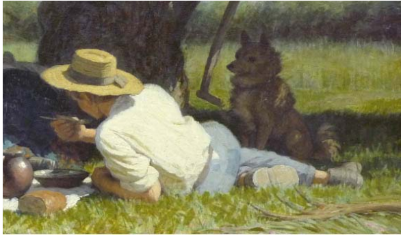
Alfred van Muyden, La Collation , 1865 Huile sur toile, 32,5 x 46 cm © Lausanne, Musée cantonal des Beaux-Arts Dépôt de la Fondation Gottfried Keller. Détail