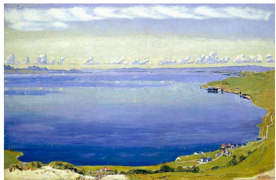
Ferdinand Hodler , Bleu Léman , 1904 Huile sur toile, 70,5 x 108,3 cm