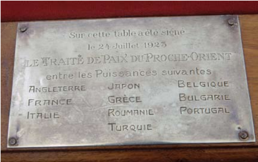
Plaque gravée posée sur la table du Traité de Lausanne.