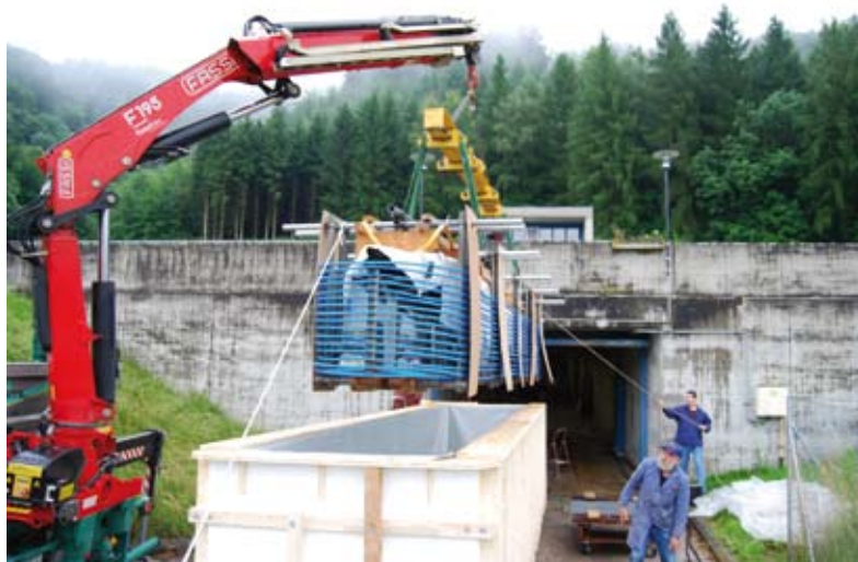
La pirogue de Chabrey installée dans son bac de traitement ad hoc, entre au DABC à Lucens.

L'équipe du Musée s'est vue doter de deux collaboratrices supplémentaires à 25% dans le cadre de la régularisation des postes d'auxiliaires ; ces dernières poursuivent les tâches fondamentales d'inventaire des collections et d'archivage des documents.