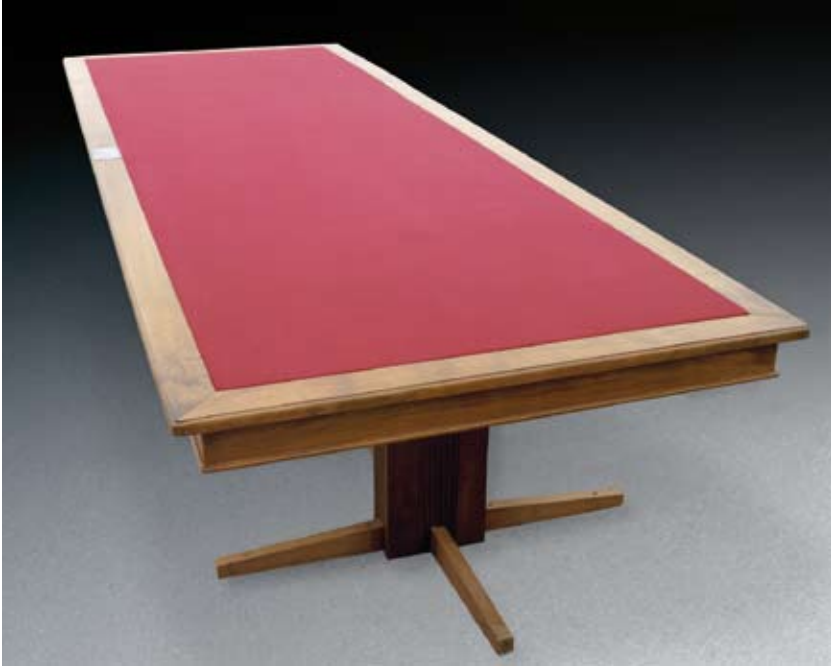
Table du Traité de Lausanne.