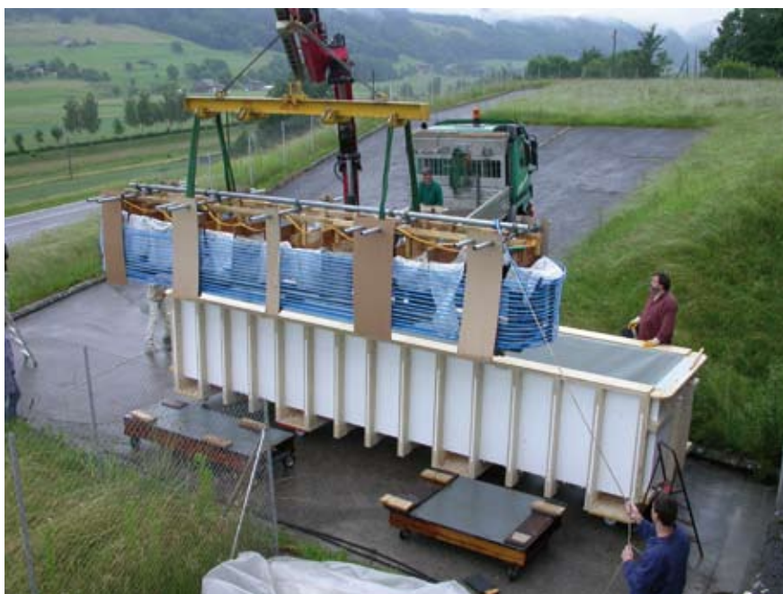
La pirogue de Chabrey sur son chassis est installée dans son bassin de traitement au DABC à Lucens.