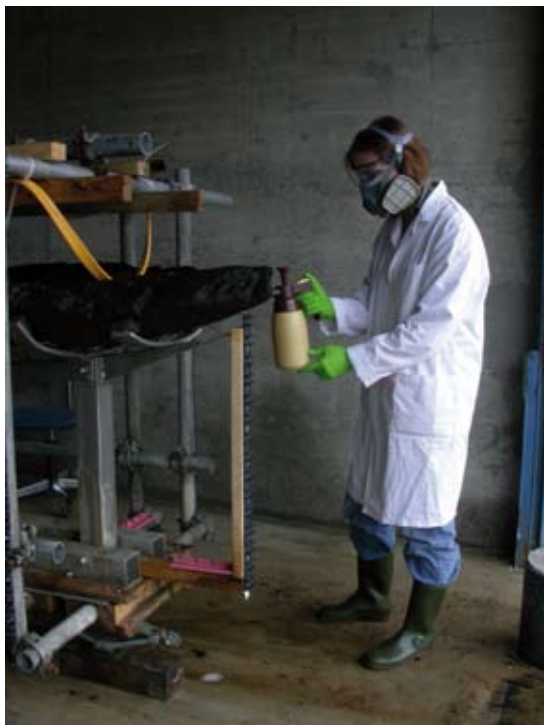
Préparation de la barque avant immersion dans le bassin de PEG.