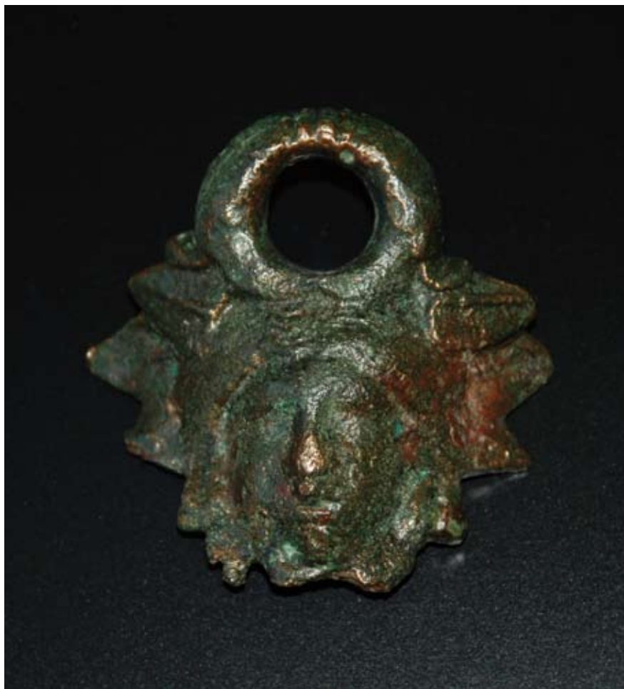
Anse de seau en bronze. Epoque romaine. Longueur 6 cm. (INV : INT1369/26007.1).

Une copie, réalisée en 2007, a pris la place de la pierre originale dans une niche aménagée à l'extérieur du bâtiment par l'architecte Perregaux.