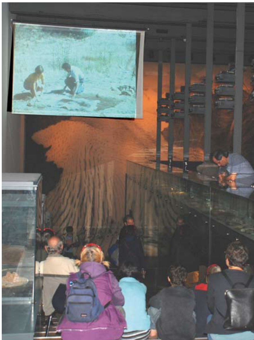
Nuit des Musées lausannois (27 septembre 2008). Projection d'un film de Pierre Barde dans une salle d'exposition permanente du Musée.