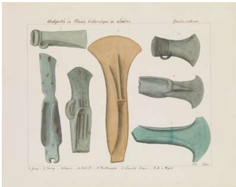
Une des pages des abums Troyon (volume 1, pl. 50).