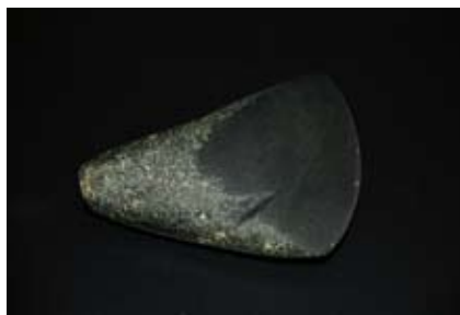
Lame de hache en pierre polie du Néolithique présentée à la Nuit de la Science à Genève, les 5 et 6 juillet.

Dans le cadre de la Nuit de la Science à Genève, dont le thème était « Le temps », le Musée a collaboré, avec 16 musées et institutions, au stand du Réseau romand Science & Cité , qui proposait une « Roue à voyager dans le temps ». Chaque institution avait préparé un lot de questions qui étaient tirées au sort par les visiteurs qui tournaient la roue. Le Musée a participé à cette animation en proposant 4 objets archéologiques (biface, bâton percé, hache en pierre polie et épingle en bronze). Le public devait replacer sur l'échelle du temps l'objet sélectionné et essayer de donner des réponses concernant son origine, son mode de fabrication et sa fonction.