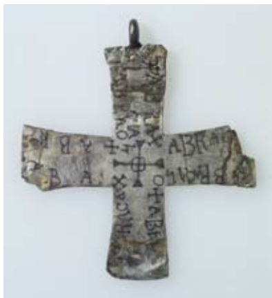
Croix en argent, datant du 6 e -7 e siècle. Cathédrale de Lausanne.