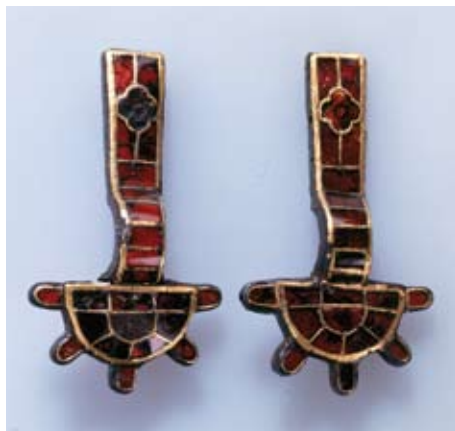
Fibules en or et pâte de verre, datant du 5 e siècle. Saint-Sulpice.