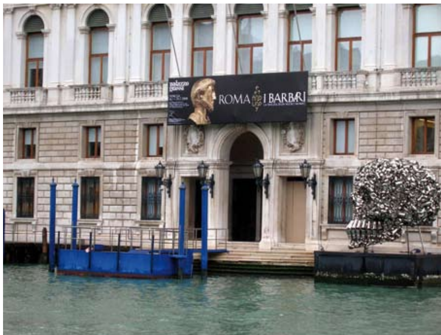
Vue du Palazzo Grassi de Venise depuis le Grand Canal.