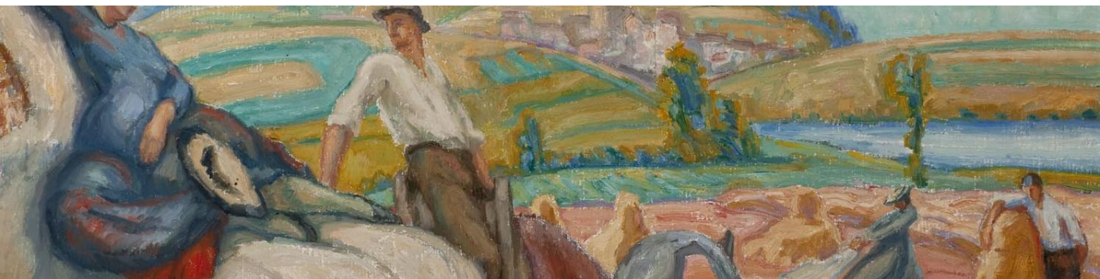
Albert Muret, Les quatre saisons. L'été (détail), 1918, huile sur toile