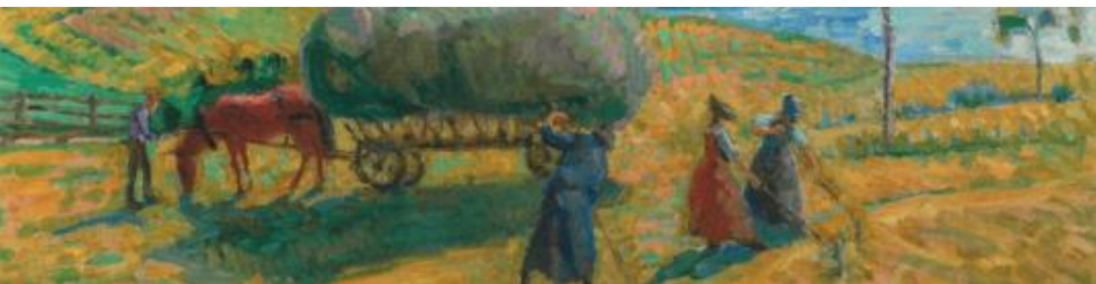
Albert Muret, Les foins (détail), 1916, huile sur toile

Commissaire de l'exposition: Bernard Wyder