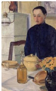
Ludivine , huile sur toile, 1903 © Neuchâtel, Musée d'Art et d'Histoire, photo. S. Iori