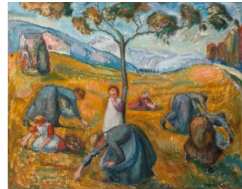
Les quatre saisons. L'automne , huile sur toile, 1918