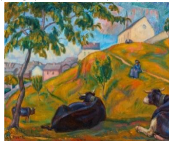
Vaches au repos dans le pré de l'église , huile sur toile, s.d.