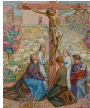
Le crucifix , huile sur toile, 1907