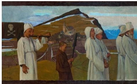
L'enterrement , huile sur toile, 1904