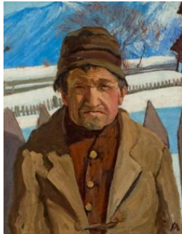
Portrait de Cyrille Bonvin , huile sur toile, 1902

L'utilisation des visuels est limitée à la promotion de l'exposition. La mention du copyright est obligatoire.