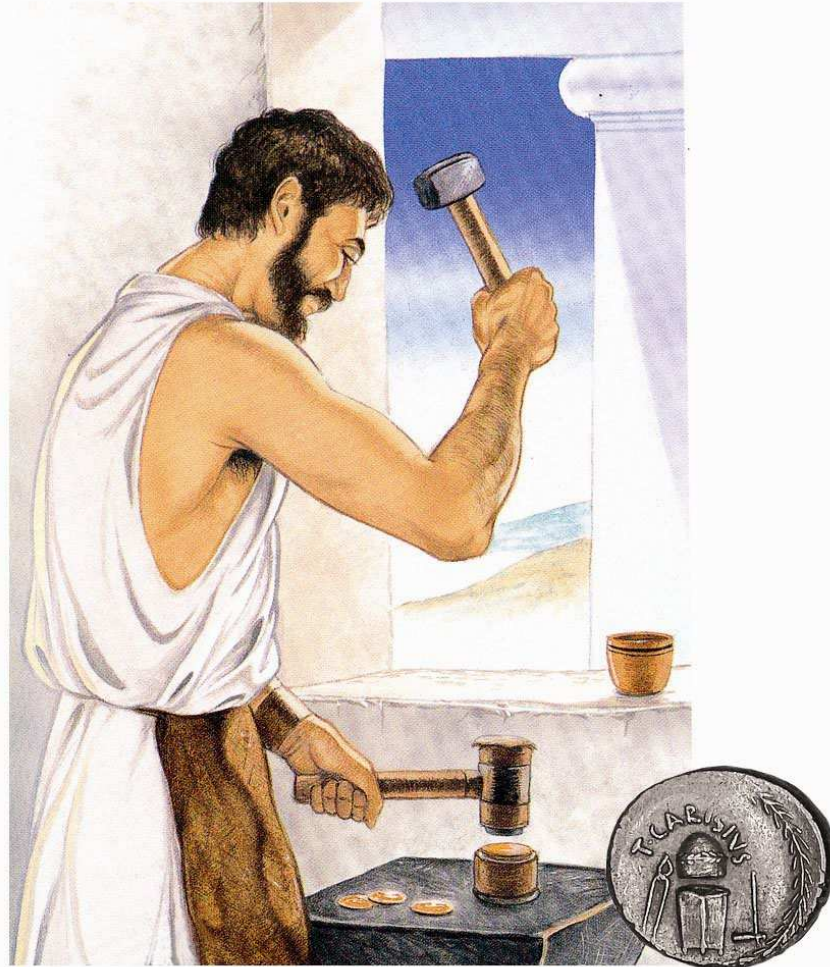
Dessin représentant un homme frappant monnaie. Reproduit dans ORNA-ORNSTEIN, John, The story of money , Londres, 1997, p. 7 et denier en argent de la République romaine sur lequel les outils de la frappe monétaire sont représentés, 46 av. J.-C. (agrandie).

Pour la fonte , le métal, principalement du bronze, est versé dans des moules formés de deux parties distinctes (pour les avers et les revers) et gravés en creux. Les alvéoles ou cavités sont généralement reliées entre elles par de petits canaux d'écoulement. L'«arbre à monnaies» ainsi obtenu est fractionné et les monnaies retouchées : leurs tranches sont taillées et égalisées, leurs surfaces polies. Parfois, des traces de cassure subsistent et témoignent de la coulée des monnaies et de leur séparation les unes des autres. Les effigies des monnaies coulées sont bien délimitées et centrées.