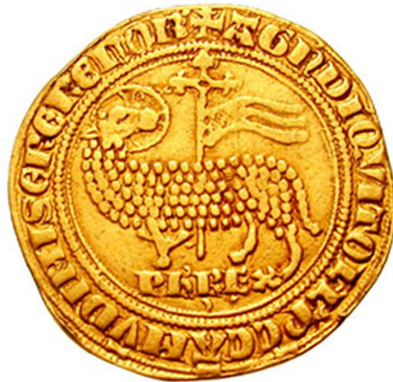
Agnel d'or de Philippe IV le Bel, 1284-1314, 4.04 g (agrandie)

Après l'avoir trouvé, vous pourrez répondre à une question sur le musée : pour quelle raison le MMC conserve-t-il des monnaies, des sceaux, ainsi que des jetons de compte servant à remplacer les monnaies lors des opérations de calcul effectuées par les changeurs ? Quel est le point commun entre ces objets?