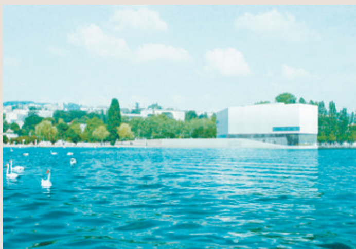
PROJET Le futur musée tel qu'il devrait se présenter, vu du lac à Vidy (photomontage).

■ 1999 Le Grand Conseil décide de faire sortir le Musée des beaux-arts du Palais de Rumine, pour cause de manque de place lancinant.