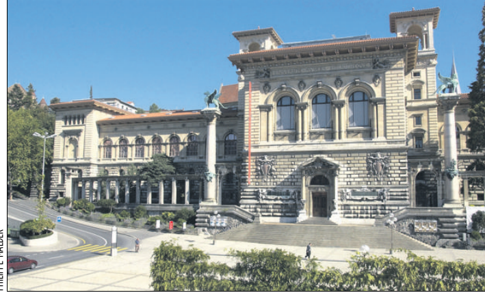
Le Musée des beaux-arts , l'aile gauche du Palais de Rumine.