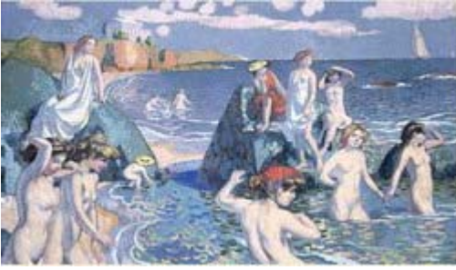
Maurice Denis , La plage au petit temple , 1906