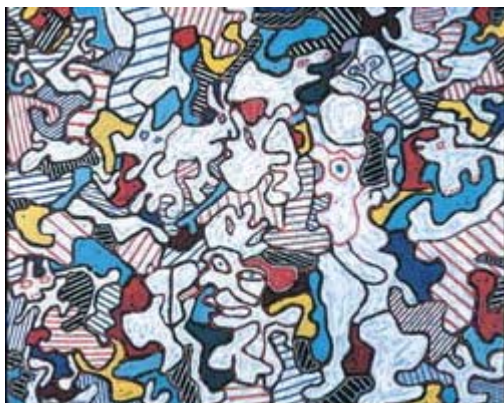
Jean Dubuffet, Opéra Bobèche , 1963.