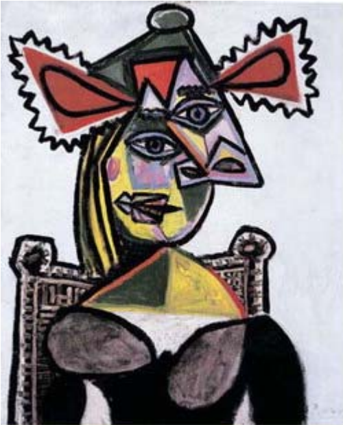
Pablo Picasso , Femme au chapeau dans un fauteuil , 1939.