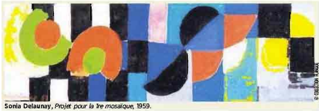
Sonia Delaunay, Projet pour la Ire mosaïque , 1959.