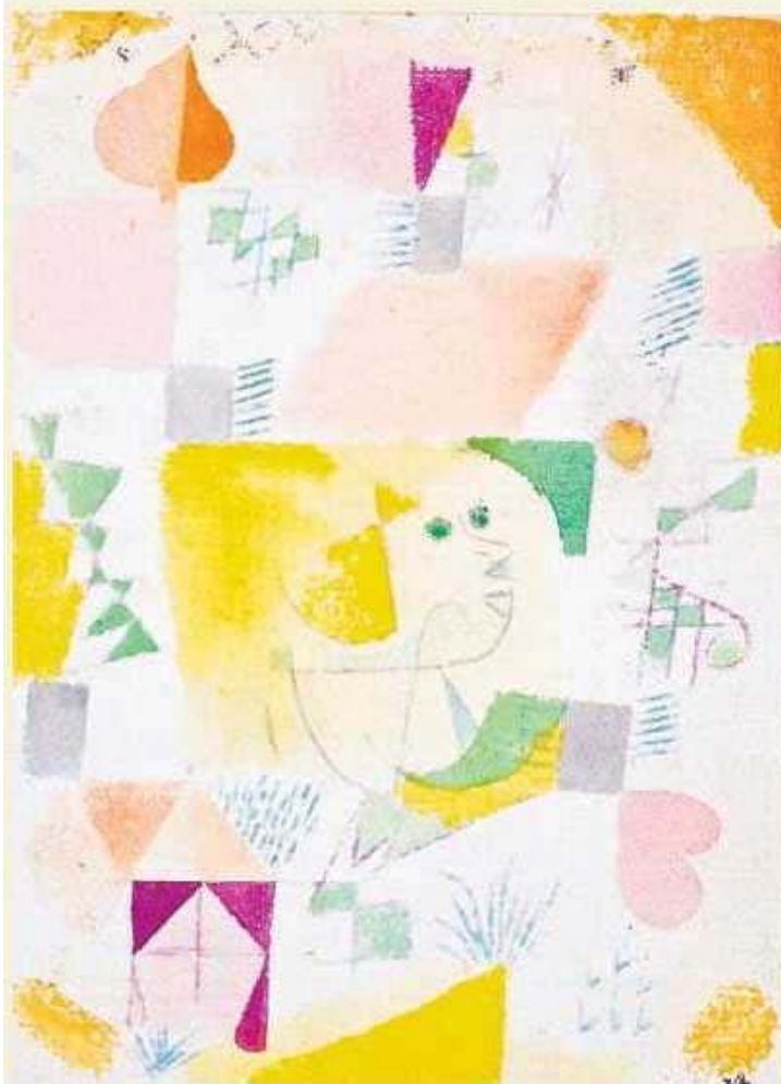
Paul Klee, Sans titre, i8 (« Kartenorakel »), 1919.