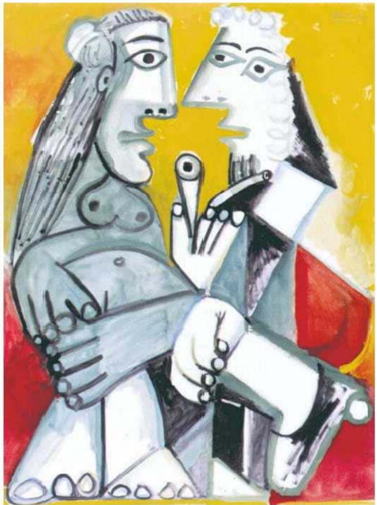
Pablo Picasso. Nu et homme à la pipe (La conversation) , 1968. Huile sur toile, 130x97 cm. Collection Jean Planque.