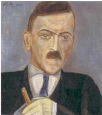
René Auberjonois. Portrait de C. F. Ramuz , 1923. Huile sur toile, 43,5x32 cm. Musée cantonal des beaux-arts.