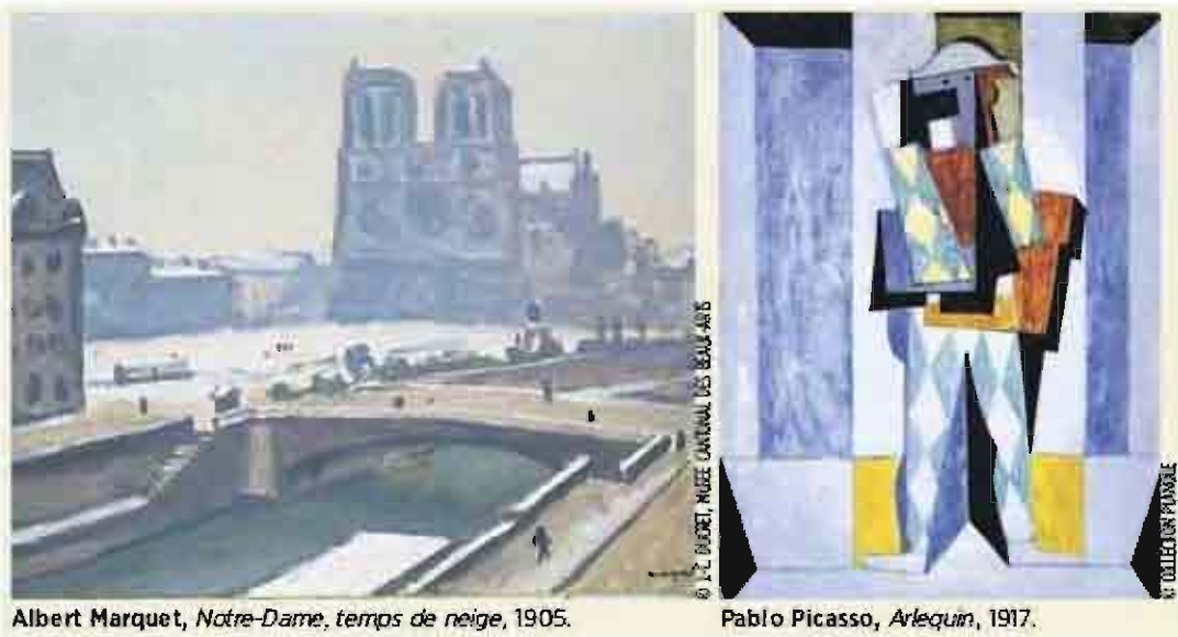
Albert Marquet, Notre-Dame, temps de neige , 1905.