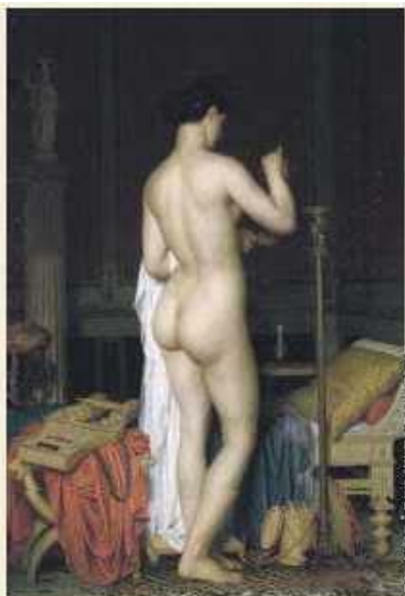
Charles Gleyre, Sappho , 1867.