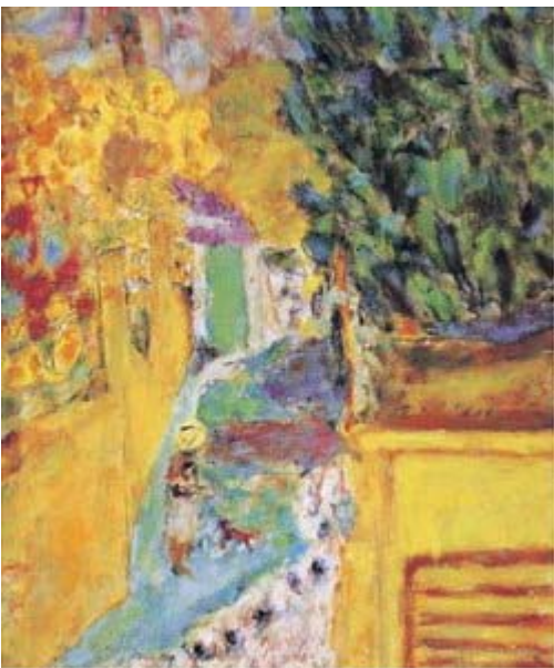
Pierre Bonnard , L'escalier du Cannet , 1946.