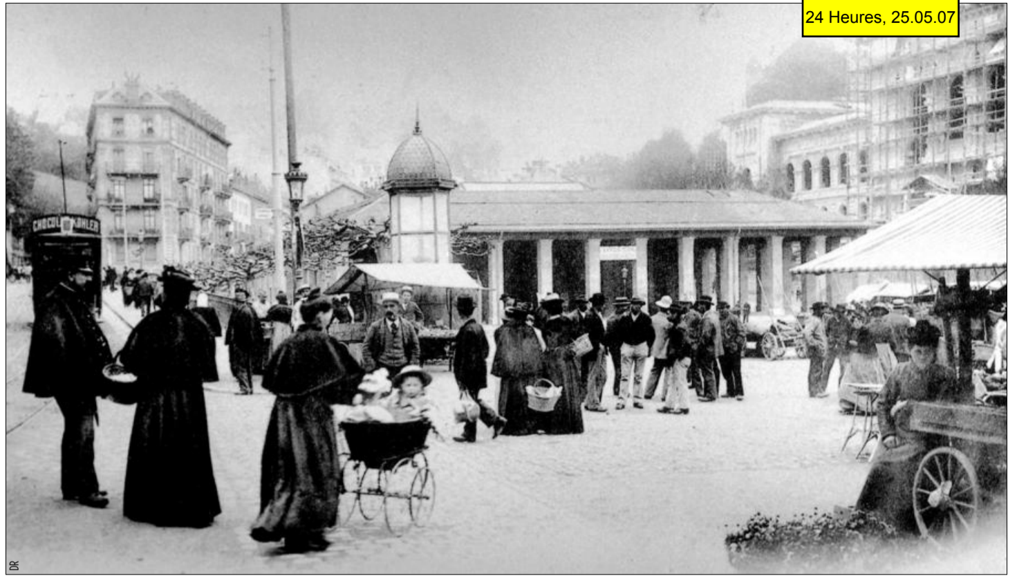
UNE VRAIE PLACE Le Palais de Rumine a été bâti sur un espace urbain animé et attirant, comme le montre ce cliché pris un jour de marché. Cent ans plus tard, l'endroit est devenu un no man's land. PLACE DE LA RIPONNE, VERS 1906

Etabli sur une station de métro, au cœur du «quartier des musées et des galeries» déjà existant, un musée moderne installé dans un palais 1900, avec ses annexes contemporaines et ses satellites éventuels autour de la place, serait un geste aussi fort que le bâtiment de Bellerive et jouerait pleinement son rôle vivifiant vis-à-vis du centre-ville. ■