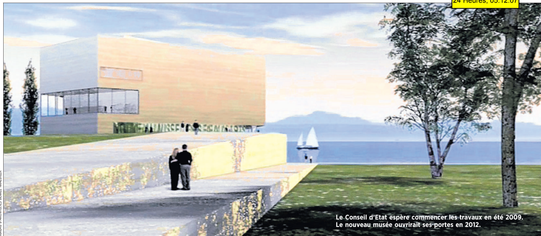
Le Conseil d'Etat espère commencer les travaux en été 2009. Le nouveau musée ouvrirait ses portes en 2012.