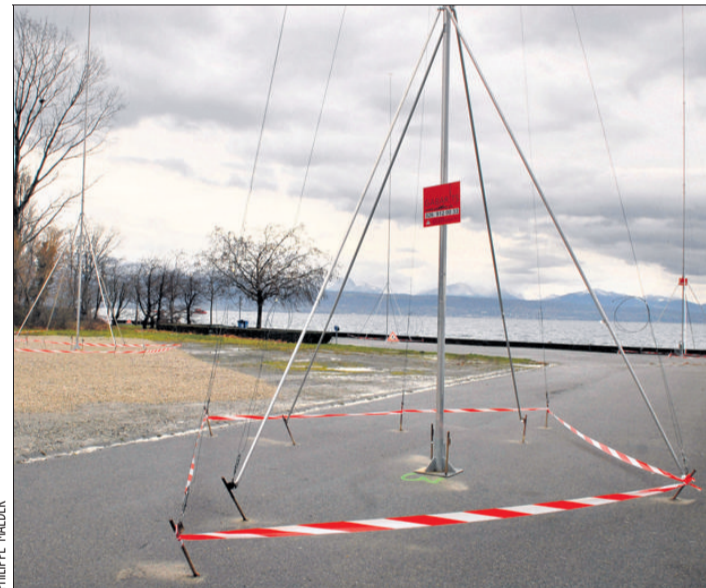
Des gabarits viennent d'être posés sur le site de Bellerive pour montrer l'emprise et le volume du futur musée.

■ NOUVEAU REVÊTEMENT Le trio d'architectes zurichois a retravaillé les façades du bâtiment de Bellerive. Selon toute vraisemblance, elles seront striées de lignes horizontales en «béton vitrifié», espacées de 5 à 30 centimètres. Une manière d'atténuer l'effet bloc de béton? «Non, s'offusque Eric Perrette. Ce sera une plus-value esthétique. Ces lignes de différentes couleurs entreront en résonance avec le lac.» ■